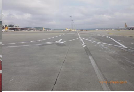
Şekil 1: R Taksiyolu Üzerindeki Deplase Edilen Araç Geçiş Yolu